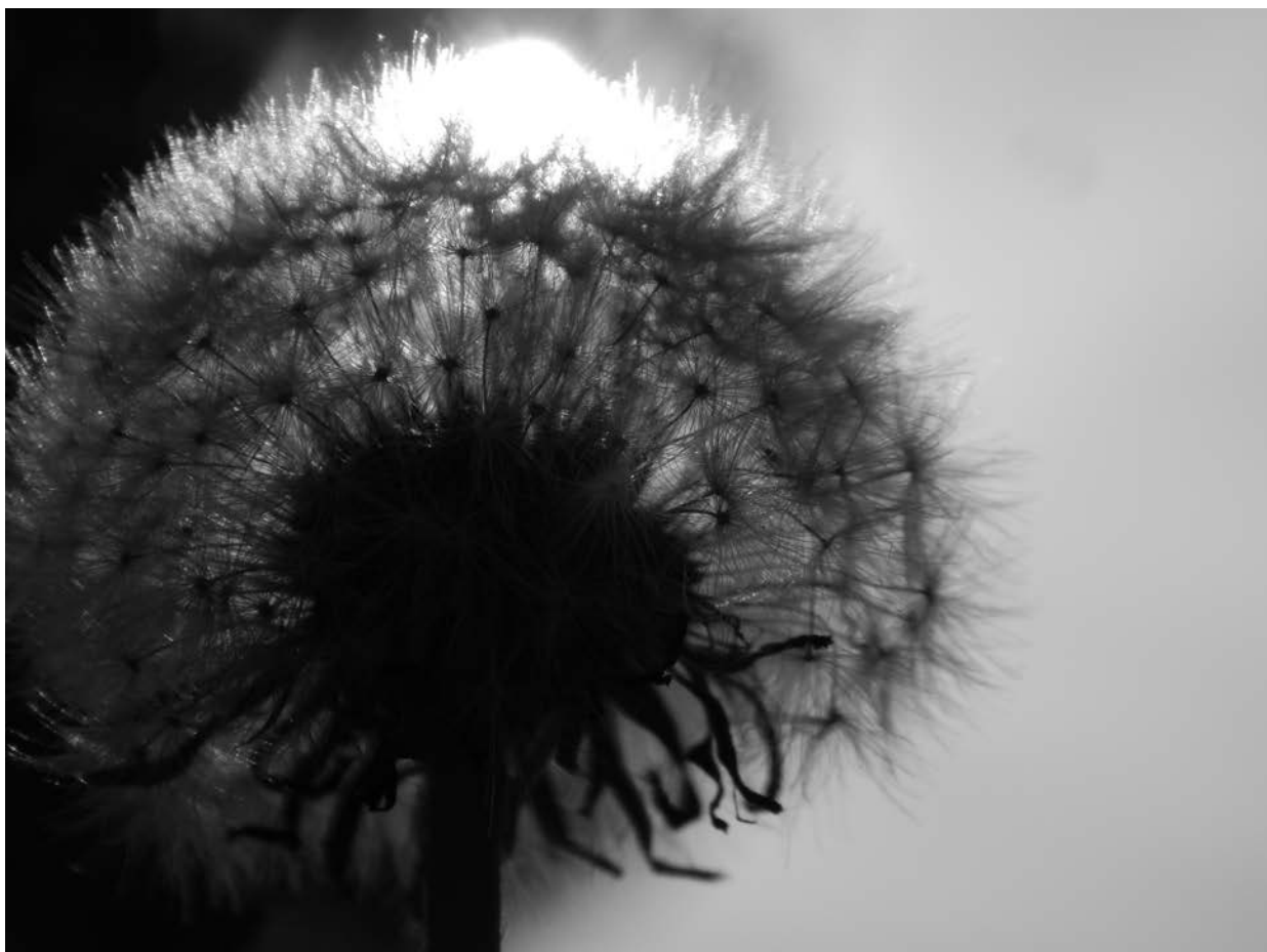
Kertész Ambrus fotója, Fóti Waldorf Iskola 8. osztály