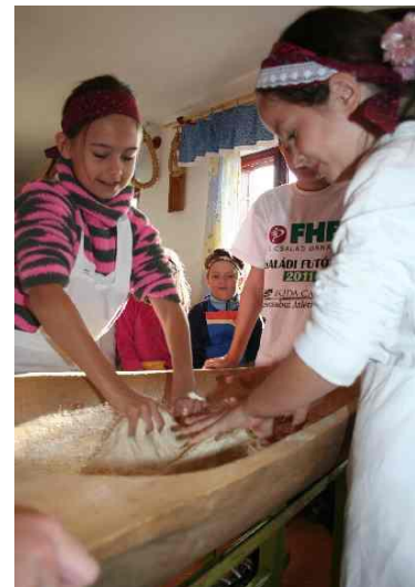
Fotó: Tanyapedagógia (2015)

Magyarországon 2003-ban, különféle pályázati források támogatásával indult a hazai „autista majorságok” létrehozása és fejlesztése. Az autista farmok fejlődése a források beszüntülésével az elmúlt években megrekedt. A hazai szociális farmművelési kezdeményezések tárháza viszont egyre sokszínűbbé vált. Komplex szolgáltatási modellt hozott létre pl. a miskolci Szimbiózis Alapítvány . 5 hektáros Baráthegyi Majorságában kertészet, állattartás, élelmiszergyártás, asztalosüzem működik, szociálterápiát folytatnak, de van itt kézműves műhely, panzió, erdei iskola is. Hernádszentandrásan a BioSzentandrás Programot a magas munkanélküliség és a kilátástalanság leküzdésére indították. Széles termékpalettból álló mintagazdaságot hoztak létre, oktatást indítottak a helyieknek. Ma 2,6 hektáron gazdálkodnak, 25-30 helyi embert vontak be a működésbe, termékeik jelentős részét feldolgozzák és sikerrel értékesítik. A hazai jó példák közül kiemeltük még az E-Misszió Egyesület által kezdeményezett Tanyapedagógia Programot , a Vodafone Társadalmi Felelősségvállalás Alapítvány „Főállású Angyal” támogatásával létrehozott Falusi Porta Tanoda hálózatot ; az MNVH Közösségi Tanulókert Hálózatát , és a Váci Egyházmegye Vidékfejlesztési Iroda (VEVI) szakkörét , ami az általános iskolás gyermekekkel ismerteti meg a kertművelést.