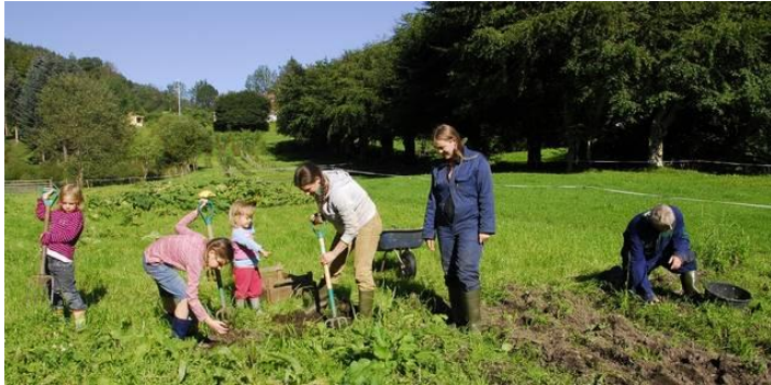
Hogganvik farm, Vikedal