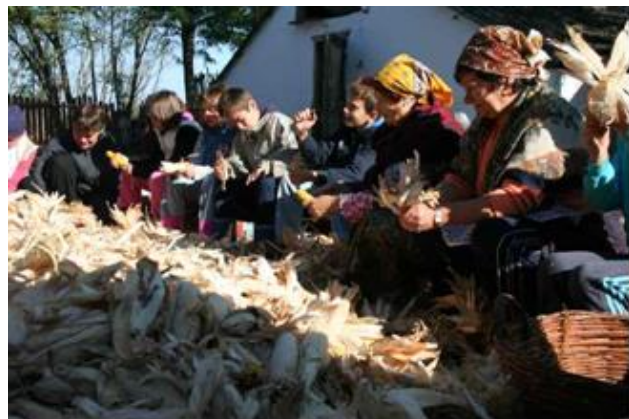
Forrás: Tanyapedagógia (2015)

A szociális farmok fejlesztése, számuk növelésének hosszú távú célja a vidéki környezet vonzóvá tétele, a passzív ellátásban lévő hátrányos helyzetűek bevonása és az aktív, munkaalapú jövőkép széles körű elterjesztése is. Jövőképünk alapján a farmok hálózatának bővülése hozzájárulhat többek között a vidék megtartó erejének növeléséhez; a hátrányos helyzetűek életminőség-javításához; munkahelyeket teremthet; fejlesztheti a társadalmi integrációt a gyakorlatban. Reményeink szerint néhány éven belül akár ezer szociális farmról számolhatunk be. Javasoljuk szociális farm „startup” támogatás kialakítását; a jó példák bemutatásának intézményesítését segítő rendszer indítását; továbbá a Magyar Szociális Farm Szövetség megalakítását kezdeményezzük.