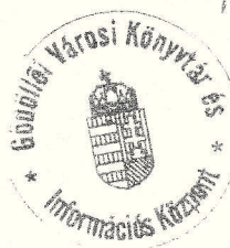
Fülöp Attiláné könyvtár igazgató