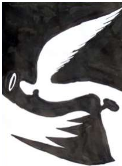
Major Enikő (11. osztály) munkája

több mint 20 éve, hogy találkoztam a Waldorf pedagógiával. Ha visszagondolok a kezdetekre, nyilván tisztességes „tanuló” voltam. Az első Waldorf óvónőképzésre jártam, ahol „nagy nevek” tanítottak. Amikor elkezdtem Waldorf óvodában dolgozni, igyekeztem mindent a tanultak szerint tenni. Idővel arra jöttem rá, hogy ha ez a tudás elég mélyre került az emberben, s folyamatosan bővíti, erősíti, akkor van egy valami, ami ezt felülírja. Ez a kisgyerek. Ő a legfontosabb! A gyerek, akinek észre kell venni a változó igényeit, megtalálni a valódi szükségleteit. Mindehhez kell a Waldorf pedagógia, de ha csupán az van és nem áll mögötte egy ember valódi szellemi törekvésekkel, nem tudunk jó nevelők lenni.