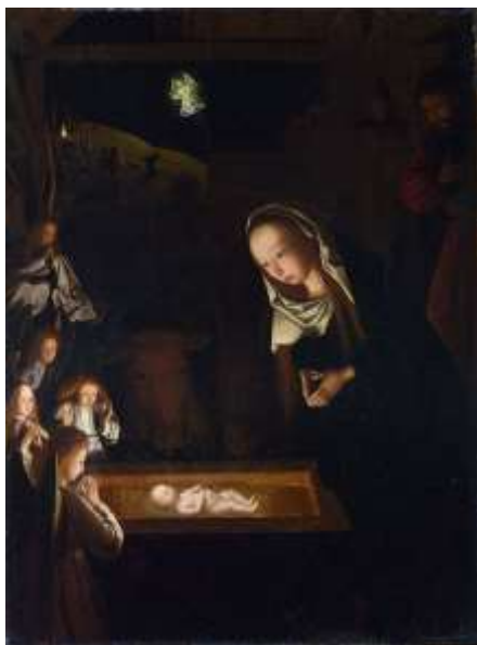
Geertgen von Haarlem—Krisztus születése; cca. 1490