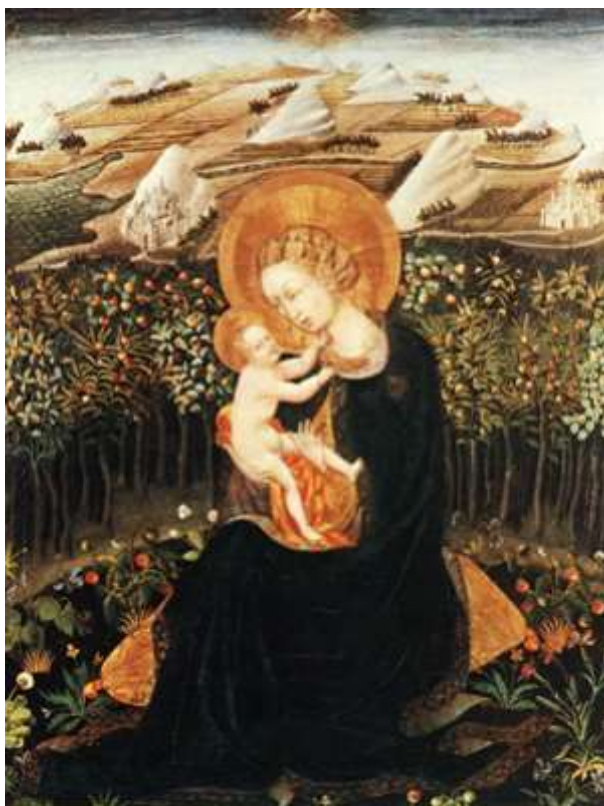
Giovanni di Paolo Az alázat Madonnája Cca. 1435.

Egy rózsza zsenge szára Dsida Jenő fordítása -- ó- német karácsonyi dal