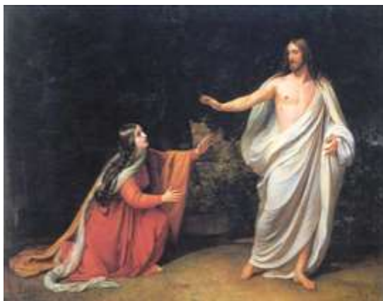
Alexander Ivanov: Krisztus megjelenik Mária Magdolnának

amikor komoly, egészen komoly dolog lesz az érthetetlen halál szemlélése. De ez az idő még csak jön majd. Még a pap az isten szenvedéseit és feláldozását celebrálta, ez nyújtott vigaszt: még nem jött el az ideje, hogy