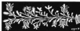
Hímes tojások és kiterített díszítésük A. Sárkőz; B. Surd (Tolna megye)

lehet megtekinteni, ami a Kr. e. 9-7. századból származik, és egy babiloni sírban találták. Nagyon sok régi nép gyakorolta ezt a szokást, és még napjainkig is fennmaradt Görögországban: húsvétkor a sírokra egy piros tojást tesznek. A sírokban a tojás adja a remény magvát egy új élethez.