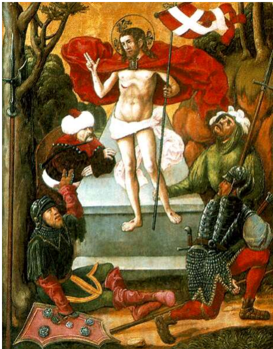
Liptószentandrásai oltárkép; 1512.