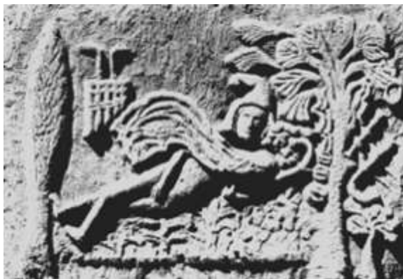
Attis isten temetése; dombormű

juk, hogy végtelenül csábító a pogány misztériumkultuszokat szemlélni és összehasonlítani őket a kialakult keresztény húsvéti misztériummal. Vegyék csak az itt tekintetbe jövő fríg ünneplés mondhatjuk hú leírását. De más ünneplést is ugyanúgy felhasználhatnánk, ahogy a fríg ünneplést, mert ezek hasonlóképpen nagyon elterjedtek voltak. Firmicus például a Konstantin fiaihoz írt levelében így beszél el a fríg ünneplést. Attis, tehát egy bizonyos isten – nem is kell részletezni, milyen isten – képét fatörzsre erősítették,