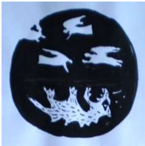
Kóhalmi Ákos, művésztanárunk alkotása; hetedik osztályos téma; tus

Egy diplomátikus levél jött válasznak, ami- ben a remek ötlet megvalósításának feltételei szerepeltek. A feltételek