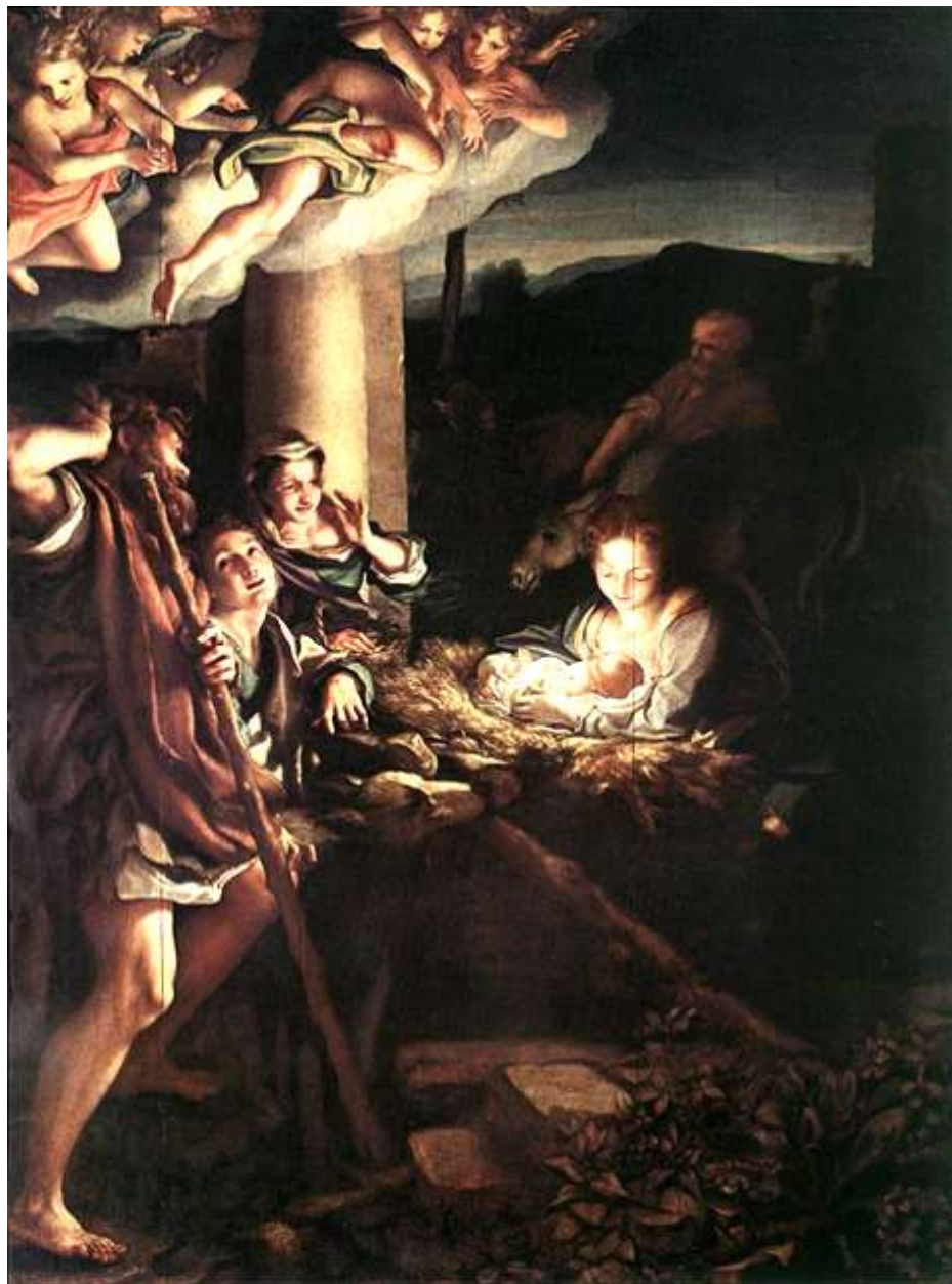
Antonio Allegri Correggio Születés (Szenteste) 1528-30., Gemäldegalerie, Drezda