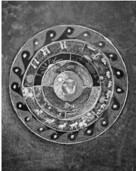
Alkotók: Kiss Réka, Price Virginia, Várkonyi Dalma, Zoltán Csenge és Zsók Viki, 5. osztály

Érzékekről és észlelésekről beszél Steiner, melyeknek az összefonódottságát,